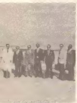
...la pa viaha pa Hulanda pa ...i trabow di Reino y promer ...ari 1979).